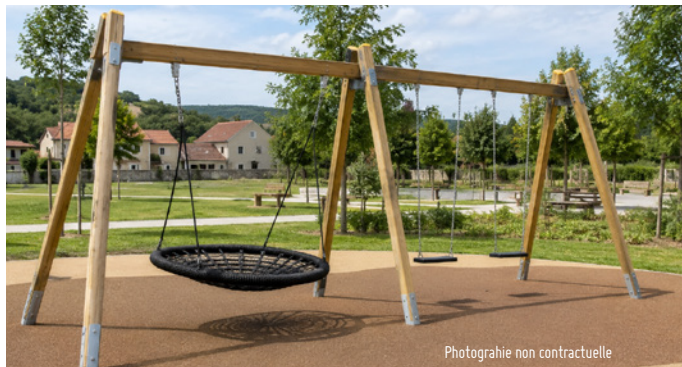
Photographie non contractuelle

Un nouvel équipement va être installé prochainement en bord de Marne : une balançoire "nid d'oiseau" grand format, conforme à la norme européenne (EN 1176), avec structure renforcée, scellement au sol, qui permettra à plusieurs enfants de jouer ensemble. De manière générale, la balançoire aide à développer l'équilibre, la coordination et la force musculaire chez les enfants. Elle offre également un lieu de détente et de socialisation, idéal en famille, entre amis, entre copains, à tous les âges.