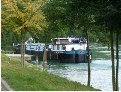
KAIROS : un bateau sur la Marne